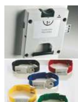
Serrure à clé prisonnière avec pièce de monnaie restituée ou encaissée + bracelet